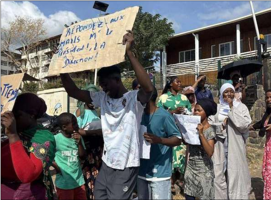
Le 8 septembre, des étudiants de l'Université de Mayotte avaient bloqué l'université, ils dénonçaient des dysfonctionnements au sein de l'établissement lors de la rentrée scolaire

Faute de papiers à jour, un certain nombre d'étudiants ne peut s'inscrire à l'Université de Mayotte, mais beaucoup continuent à venir en cours malgré les risques que cela représente, notamment d'être expulsé du territoire.