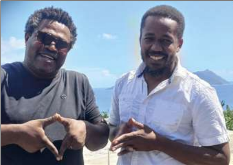
Révéler l'an dernier sur la Scène Ouverte, le groupe Mwalim Klan est de retour (Photo Milatsika Festival).

Les 17 et 18 octobre, le Plateau de Chiconi accueillera la 19 e édition du Festival Milatsika. Entre héritages de l'océan Indien et sonorités venues d'ailleurs, deux soirées de concerts inviteront le public à célébrer la diversité et la créativité musicale.