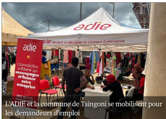
L'ADIE et la commune de Tsingoni se mobilisent pour les demandeurs d'emploi