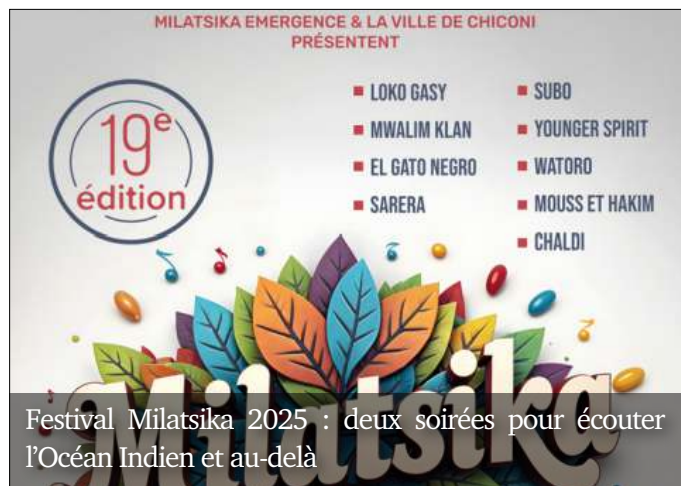
Festival Milatsika 2025 : deux soirées pour écouter l'Océan Indien et au-delà